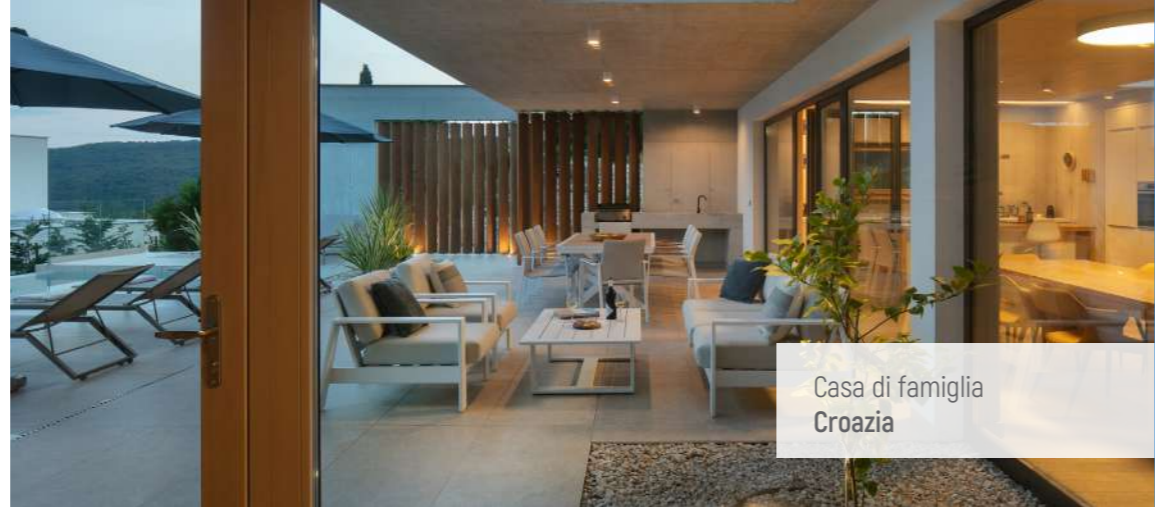
Casa di famiglia Croazia