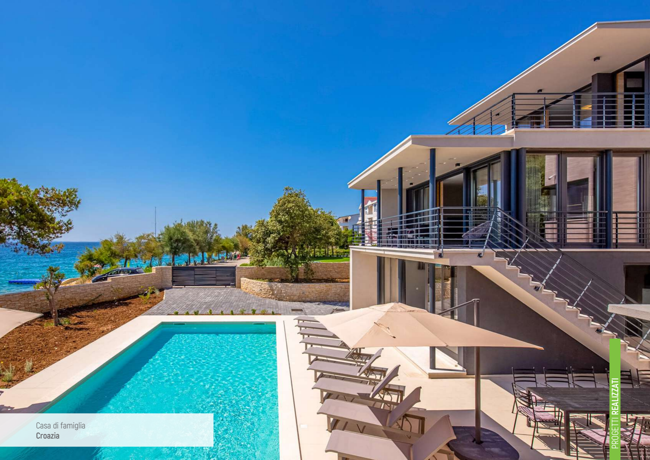
Casa di famiglia Croazia