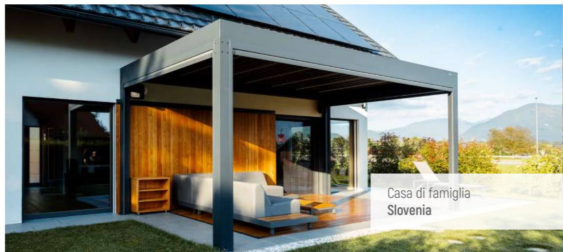
Casa di famiglia Slovenia